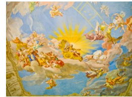
„Gesichter der Renaissance- Meisterwerke Italienischer Portraitkunst“ Thomas Hoffmann